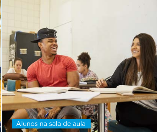
Alunos na sala de aula